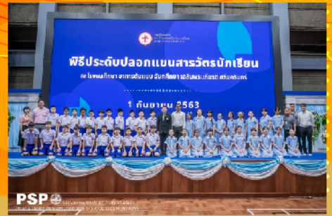
พิธีประดับปลอกแขนสารวัตรนักเรียน เมื่อวันที่ 1 กันยายน 2563