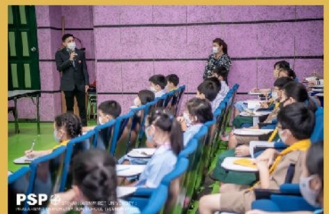
เปิดประชุมสภานักเรียน ประจำปีการศึกษา 2563 เมื่อวันที่ 6 ตุลาคม 2563