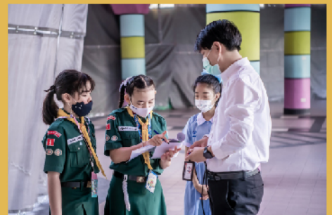
การปฏิบัติงานของกลุ่มสารวัตรนักเรียน