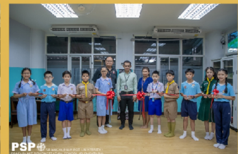
กลุ่มประธานนักเรียน ทำการเปิดโครงการตู้ปันสุข ซึ่งเป็นโครงการตามนโยบายของสภานักเรียน เมื่อวันที่ 14 ตุลาคม 2563