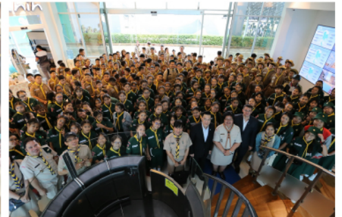
10 - 12 ม.ค. 61 เข้าค่ายพักแรมลูกเสือ - เนตรนารี ระดับชั้นประถมศึกษาปีที่ 6