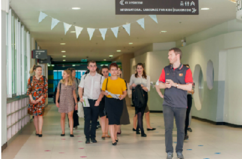
08 - 26 ม.ค. 61 - นิสิตจาก Canterbury Christ Church University และ Liverpool John Moore University เข้าฝึกปฏิบัติการสอน