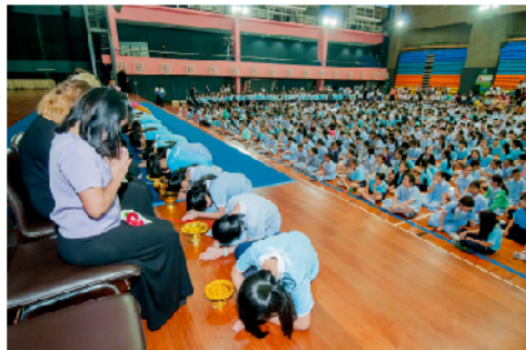
16 ม.ค. 61 - กิจกรรมวันครู " 16 มกรา บูชาพระคุณครู "