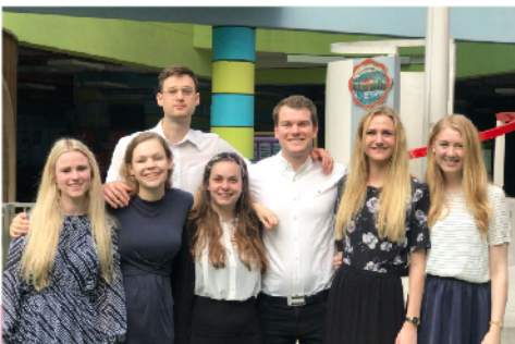
นิสิตฝึกประสบการณ์วิชาชีพครู จาก VIA University College ประเทศเดนมาร์ก