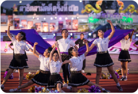
พิธีเปิด