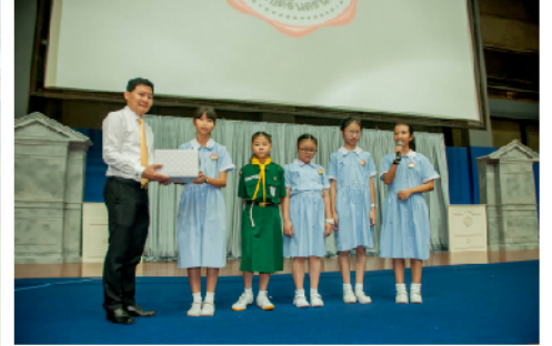
08 ม.ค. 61 - กลุ่มประธานนักเรียนมอบของขวัญปีใหม่ให้กับโรงเรียน