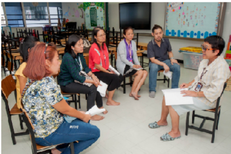
15 - 16 ม.ค. 61 - ผู้ปกครองนักเรียน พบอาจารย์ประจำชั้น รับใบแจ้งคะแนนสะสม ครั้งที่ 3