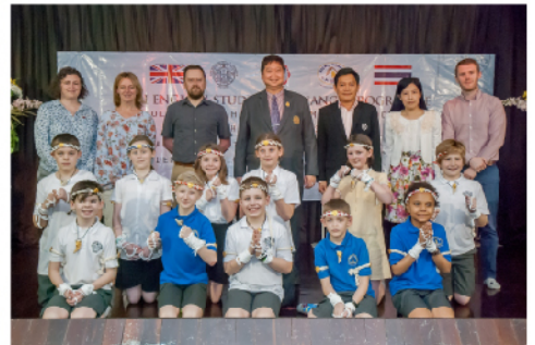
09 - 16 ก.พ. 61 คณะนักเรียนและอาจารย์โครงการแลกเปลี่ยน ไทย-อังกฤษ จากโรงเรียน Goldsbrough C.E. Primary School และ Sicklinghall Community Primary School จากประเทศอังกฤษ จำนวน 14 คน ได้เข้าร่วมกิจกรรมการเรียนการสอน