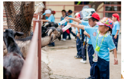
26 ม.ค. 61 - นักเรียนระดับชั้นเด็กเล็ก ทักษะศึกษาสวนสัตว์ดุสิต